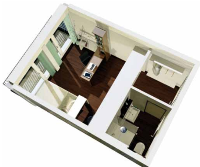
Exemplarische Darstellung eines Apartments

Das Objekt wird mindestens nach den KfW 70-Richtlinien konzipiert und benötigt daher rund 30 % weniger Primärenergie pro Jahr als ein vergleichbarer Neubau. Damit orientiert sich die Fondsimmoblie ganz nach den neuesten Richtlinien der Umweltverträglichkeit und Energieeffizienz.